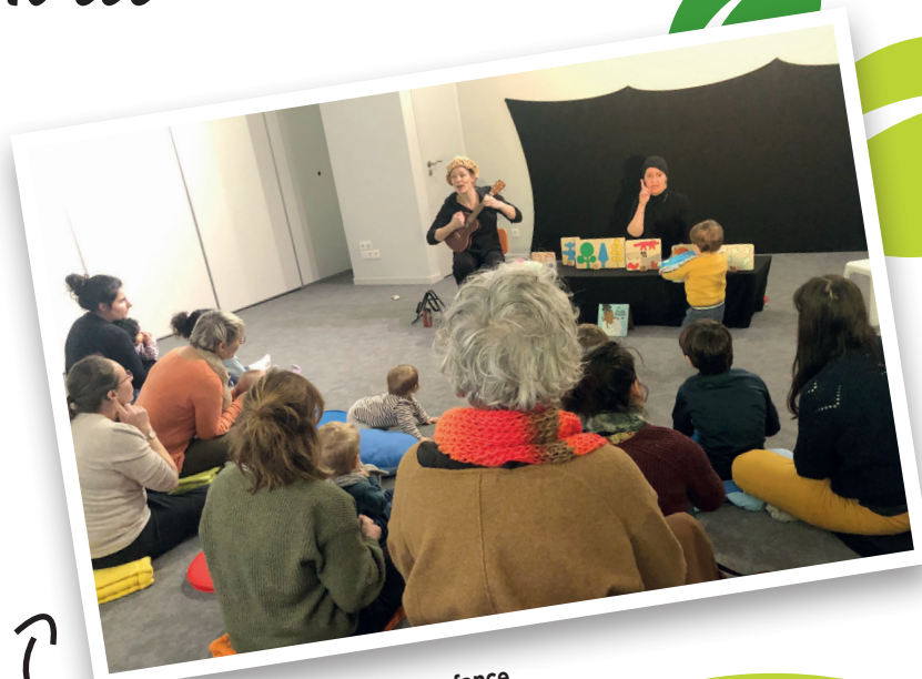
Semaine nationale de la petite enfance