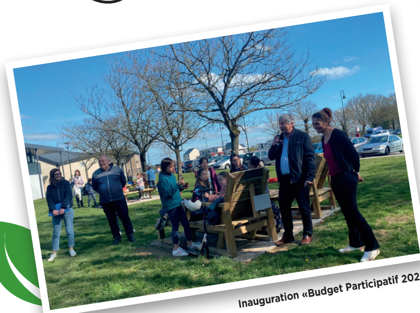
Inauguration «Budget Participatif 2022»