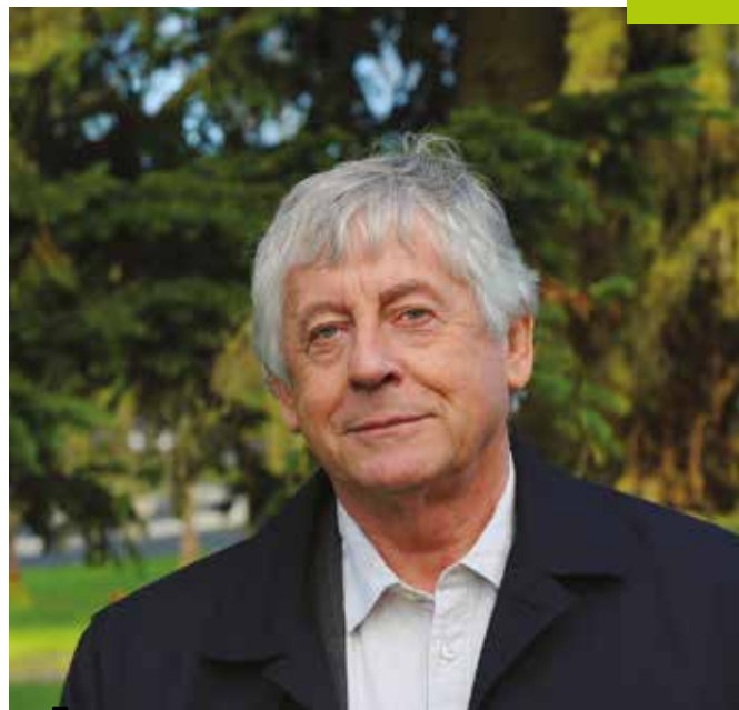
Jean-Marc Legagneur Maire de Nouvoitou