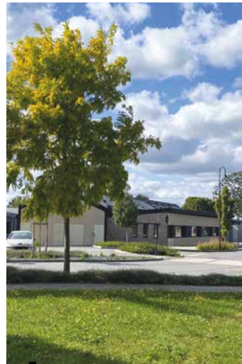
Le restaurant scolaire Atelier “Complexe scolaire”

Par exemple, l’atelier “Complexe scolaire” (2013- 2019) qui a porté ses réflexions sur la création de nouvelles classes et du restaurant scolaire, ou encore les ateliers « Bosquets de l’Yaigne”, “Zac de la Lande” et “le bio à la cantine scolaire”. 12 ateliers ont ainsi été ouverts.