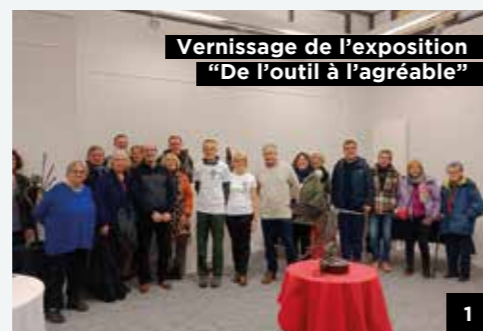
Vernissage de l'exposition "De l'outil à l'agréable"