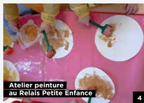
Atelier peinture au Relais Petite Enfance