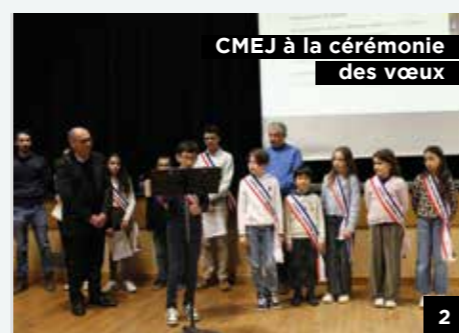
CMEJ à la cérémonie des vœux