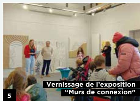
Vernissage de l'exposition "Murs de connexion"