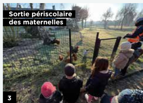
Sortie périscolaire des maternelles