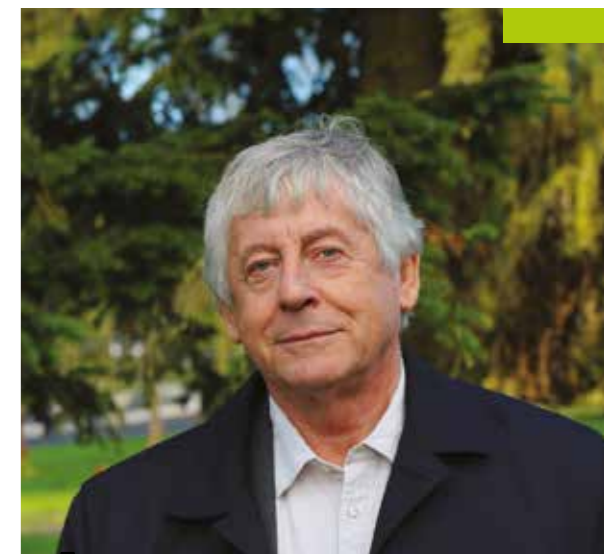
Jean-Marc Legagneur Maire de Nouvoitou