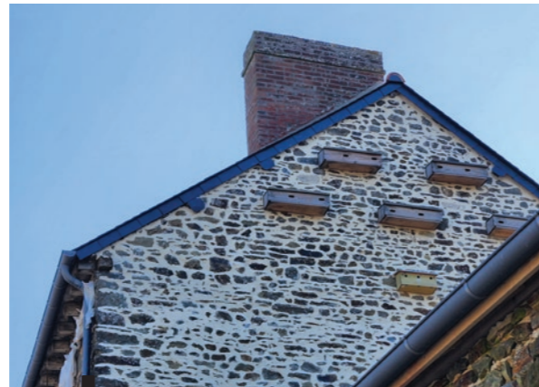
Nichoirs pour martinets Rue de Vern

Les martinets noirs sont discrets, ce qui rend leur recensement difficile. En 2019, au moins 12 nids avaient été identifiés, mais leur nombre réel pourrait être bien plus important.