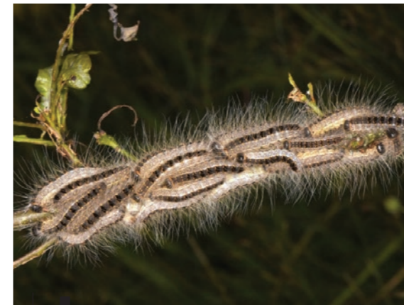
Chenille processionnaire du chêne

Période d'exposition d'avril à juillet. Cette chenille ne descend pas de l'arbre, elle est ainsi compliquée à éradiquer. Sa destruction mécanique doit être effectuée par des prestataires spécialisés.