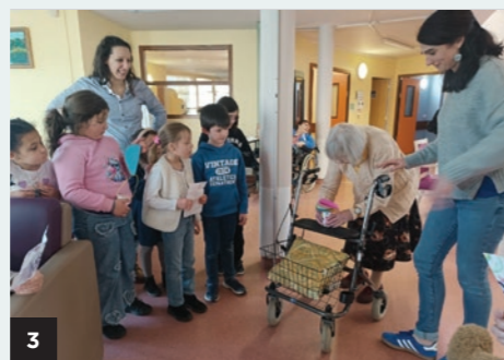
Rencontre entre les enfants du centre de loisirs et les résidents de l'EHPAD du Parmenier