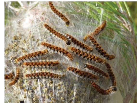
Chenille processionnaire du pin

Période d'exposition de décembre à avril. Elle descend de l'arbre. De ce fait, nous pouvons la piéger (pièges à phéromone ou pièges à colliers à installer sur le tronc de l'arbre).