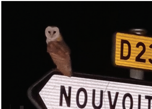
Chouette Effraie observée en 2023

Il est important de rappeler que tous les rapaces, diurnes comme nocturnes, sont protégés par le Code de l'Environnement. Il est strictement interdit de les déranger, de les capturer ou de les détruire, ainsi que leurs œufs et leurs habitats. Toute infraction est passible de trois ans d'emprisonnement et de 150 000 € d'amende.