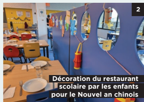
Décoration du restaurant scolaire par les enfants pour le Nouvel an chinois