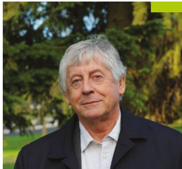
Jean-Marc Legagneur Maire de Nouvoitou