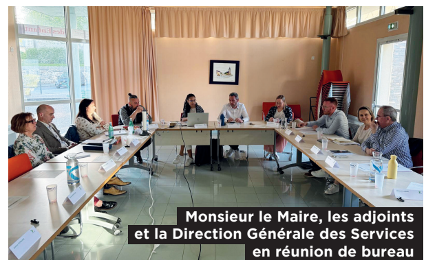
Monsieur le Maire, les adjoints et la Direction Générale des Services en réunion de bureau

Ce nouveau mandat s'organise autour d'un conseil municipal de 27 membres dont 5 membres issus de la liste minoritaire. Le maire et les adjoints constituent le bureau municipal restreint, chargé du suivi quotidien des dossiers. Autour d'eux, les commissions thématiques (urbanisme, finances, vie associative, environnement, enfance, culture, sécurité, développement économique, vie citoyenne) permettent à chaque élu d'agir concrètement dans son domaine de compétence.